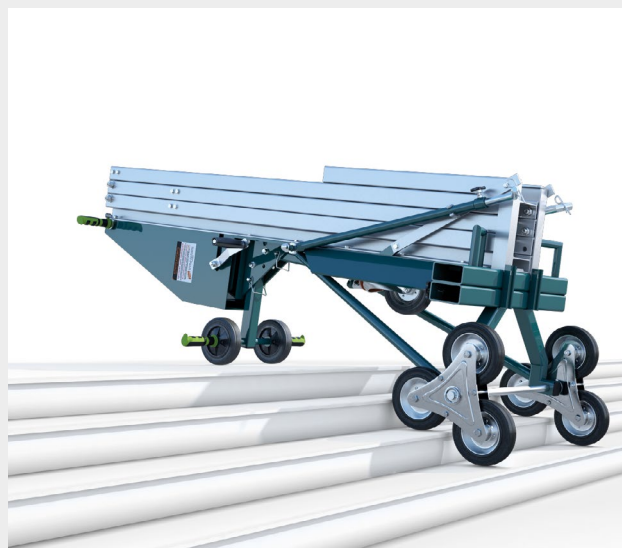
Light in modalità trasporto