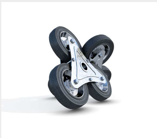
Modulo tripla ruota