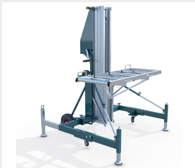
LIGHT MAXIMUM STABILIZZATO