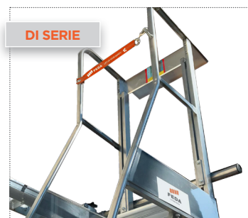
Nastro di sicurezza