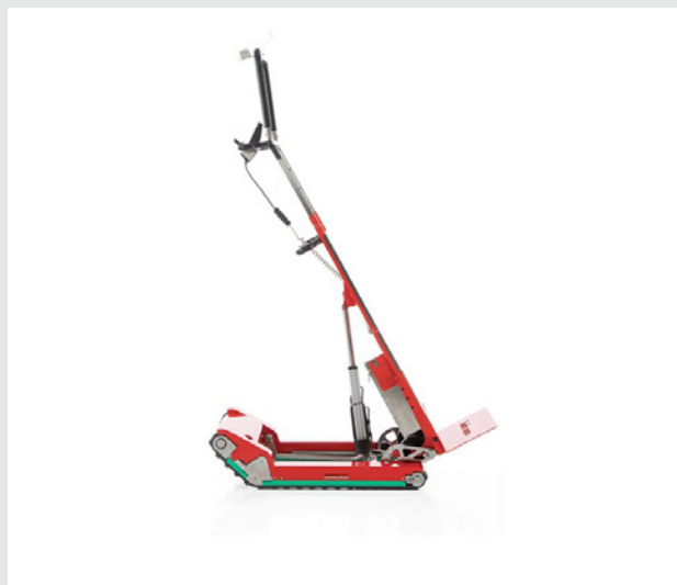
SKIPPER IN MODALITÀ TRASPORTO

Skipper è il sali-scale motorizzato ottimale per il trasporto di carichi ingombranti e feretri sulle rampe di scale. L'appoggio è garantito da cingoli in mescola brevettata, anti-macchia e anti-scivolo.