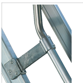
Giunzioni e supporti in alluminio fuso