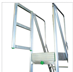
Retro apribile con cancello d'uscita