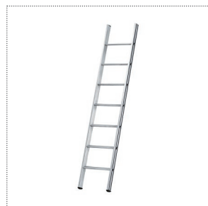
Scala frontale semplice

Scala frontale con allargatore telescopico EN131